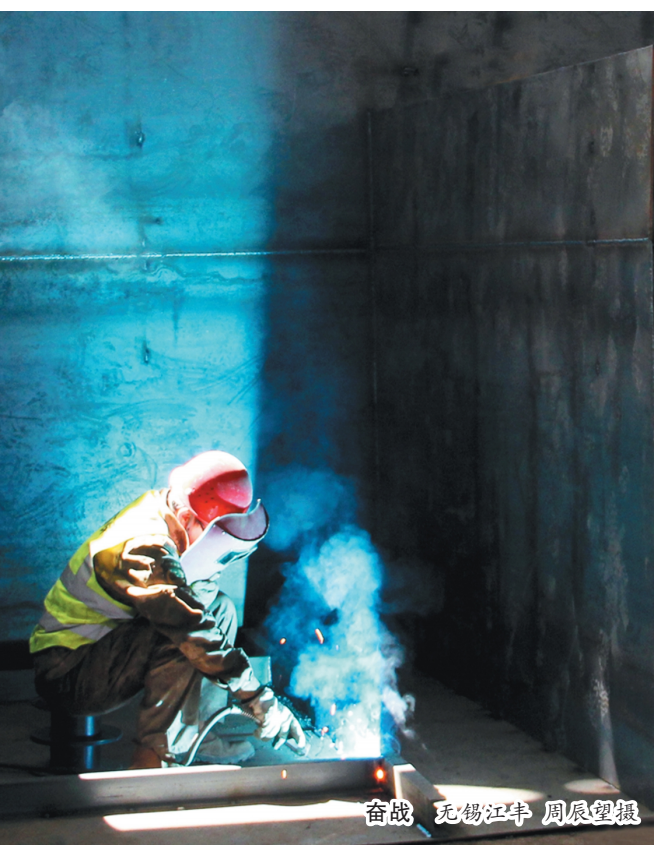
奋战 无锡江丰

把经历当成财富。曾经有段时间我迷失在繁杂的事务性工作中,不知道自己应该怎么办,内心很迷茫。幸好英科给了我发展的平台,随着集团对各类工作和报告不断更新的要求,鞭策着我登